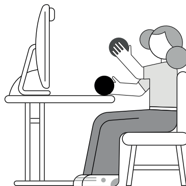
Рисунок 1. Положение тела при проведении тренировок сидя.

Важно! Игры подходят для детей от 3-х до 5-ти лет. Игра-тренировка возможна двумя руками вместе или каждой по-отдельности.