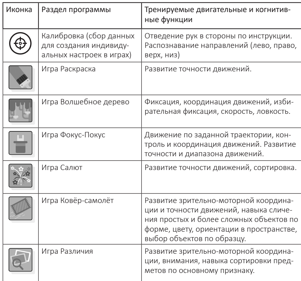
Таблица с описанием игр